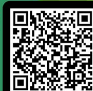
ประกาศกระทรวงสาธารณสุข