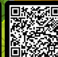
ประกาศคณะกรรมการผลิตภัณฑ์สมุนไพร